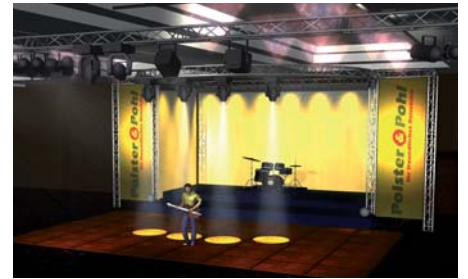
Professionelle 3 D-Software ermöglicht eine realitätsnahe Darstellung einer Veranstaltung schon in der Planungsphase.