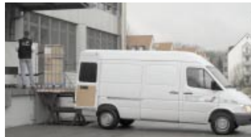
Unser Service Team im Einsatz

Bei festinstallierten Anlagen garantieren wir Ihnen schnelle Hilfe durch unsere Servicetechniker.